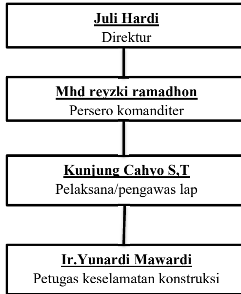
Gambar 1.2 susunan pengurus CV.ALITA