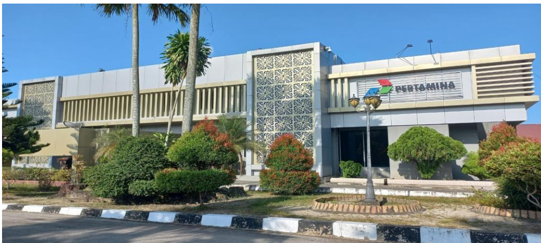
Gambar 1.3 Profil Fungsi Finance RU II