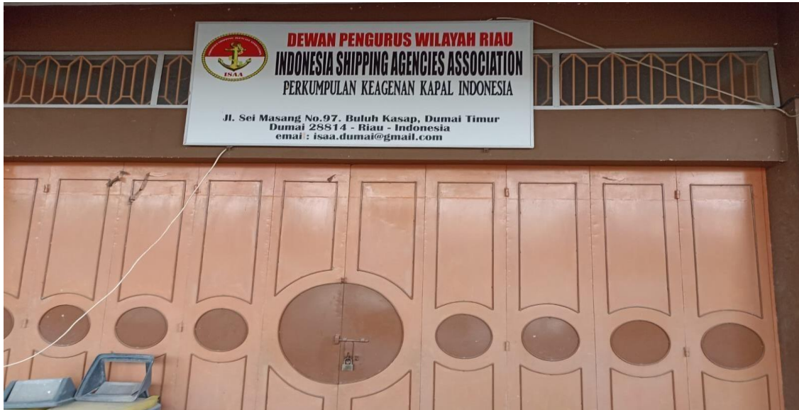
Gambar 1.1 Perusahaan PT.Wasaka Indonesia Jaya

Sejarah dan latar belakang berdirinya suatu perusahaan satu dengan perusahaan yang lain pastilah berbeda-beda. Apabila seorang atau sekelompok orang ingin mendirikan perusahaan ada suatu hal yang harus diputuskan yaitu dalam bidang dan kegiatan operasional tentang penanganan kedatangan dan keberangkatan kapal, kegiatan operasional terkait dalam perusahaan untuk menunjang kegiatan perusahaan pelayanan kapal dimulai dari kedatangan kapal hingga keberangkatan kapal.