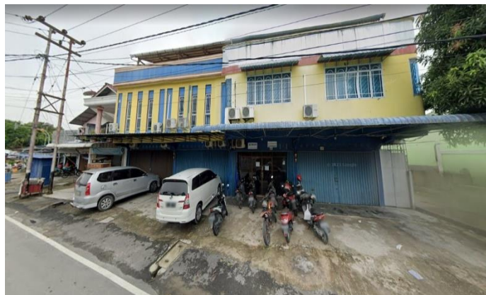
Gambar 1.2 PT. Cuaca Marina Servicatama