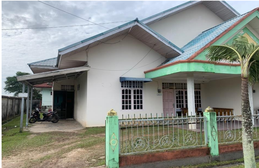
Gambar 1.1 PT. Snepac Shipping Cabang Dumai