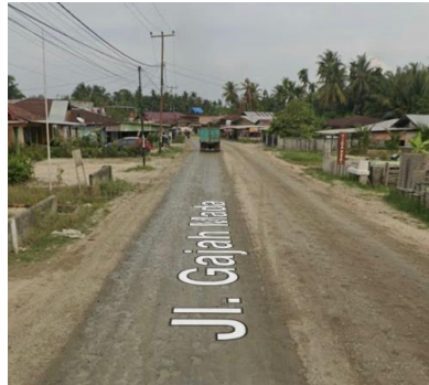
Gambar 1. 1 Jalan Sebelum Peningkatan