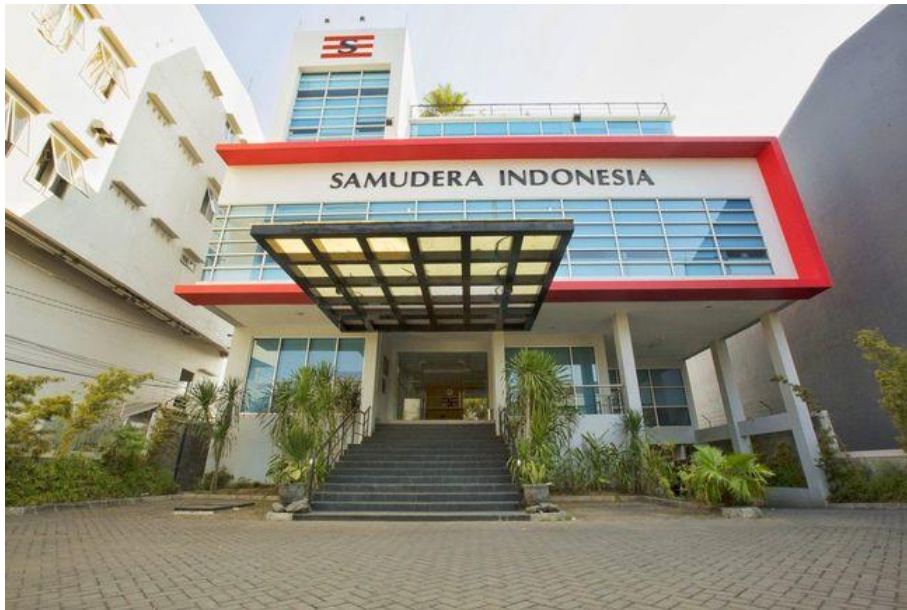
Gambar 1.1 perusahaan

Sejarah dan latar belakang berdirinya suatu perusahaan satu dengan perusahaan yang lain pastilah berbeda-beda. Apabila seorang atau sekelompok orang ingin mendirikan perusahaan ada suatu hal yang harus diputuskan yaitu dalam bidang dan kegiatan operasional tentang penanganan kedatangan dan keberangkatan kapal, kegiatan operasional terkait dalam pengusahaan untuk menunjang kegiatan perusahaan pelayanan kapal dimulai dari kedatangan kapal hingga keberangkatan kapal.