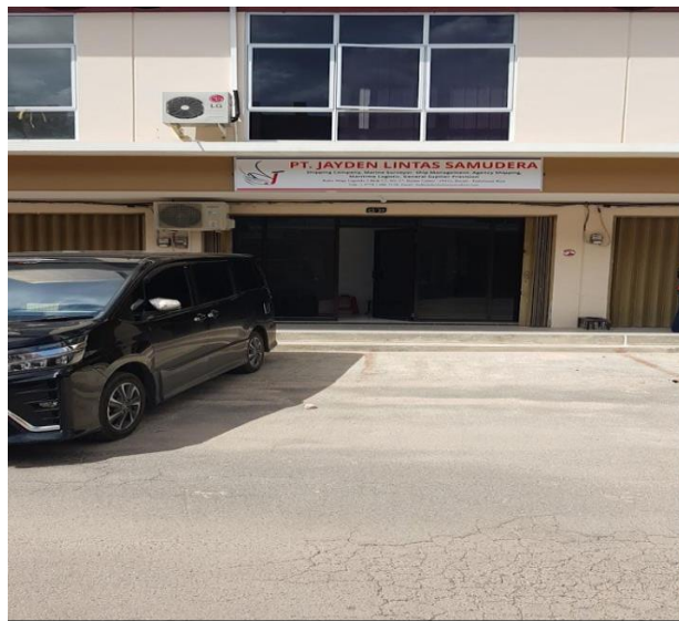
Gambar 1.1.1 Foto perusahaan PT.Jayden Lintas Samudera