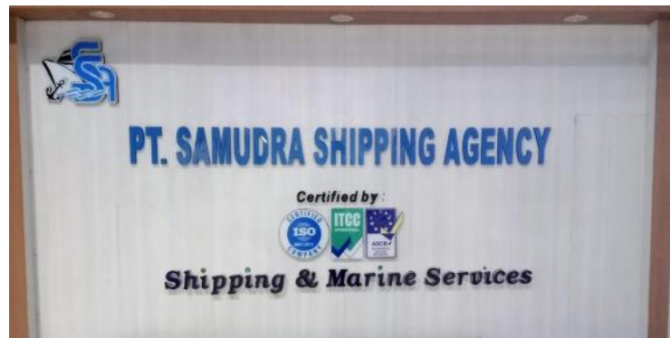
Gambar 1. 1 Profile Perusahaan