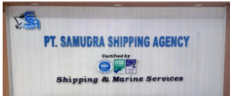
Gambar 1.1 Profil Perusahaan