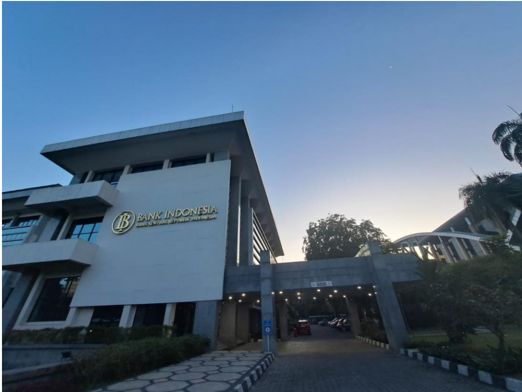
Gambar 1.2 Tampak Depan Kantor Perwakilan Bank Indonesia Provinsi Riau