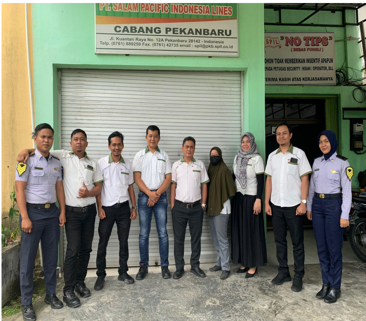
Gambar 1.1 gambar perusahaan