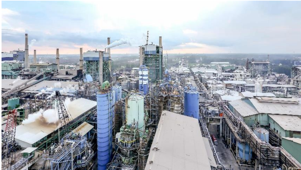
Gambar 1. 2 PT. Indah Kiat Pulp & Paper Perawang

tahun. sementara itu pengoperasian motor kertas line 3 di pabrik kertas Tangerang dilakukan disamping persiapan lokasi pabrik Pulp di desa Pinang Kabupaten Siak Sri Indrapura, Provinsi Riau. PT. Indah Kiat Pulp And Paper Perawang dapat kita lihat pada gambar 1. 2 dibawah ini.